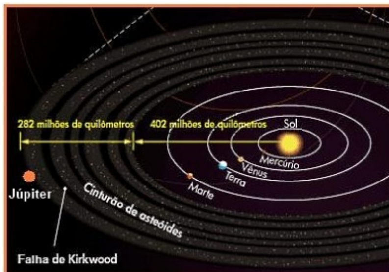
Figura 5. Localização do cinturão de asteroides.