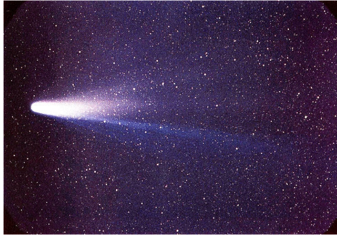
Figura 6: Meteoro.