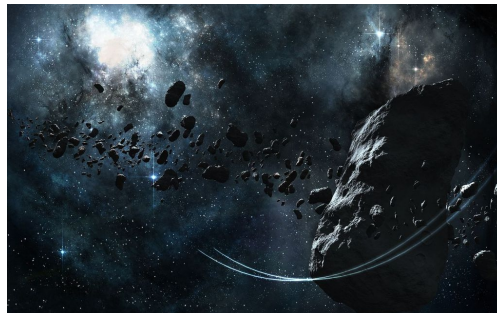
Figura 7. Meteoroides ao lado de uma rocha espacial.