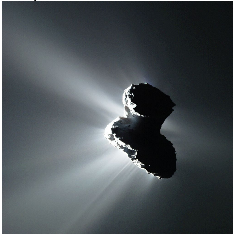
Figura 4. Imagem de um cometa.

pequenos corpos e até planetas-anões, como Plutão. O mais conhecido é o Cometa Halley.