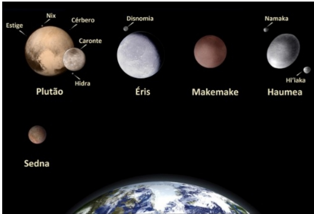
Figura 3: Planetas anões do sistema solar.