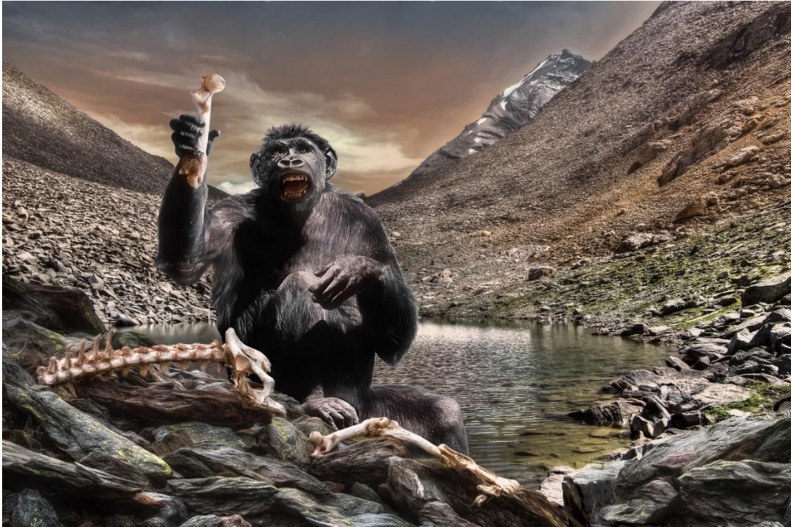
Figura 1. Exemplo de Australopithecus.